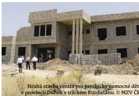
Hrubá stavba centra pro psychicky nemocné děti v provincii Duhok v iráckém Kurdistanu.

V srpnu 2018 byla dokončena hrubá stavba centra pro psychicky nemocné děti v provincii Duhok. Dokončení výstavby je plánováno na březen 2019. Na stavbu jsou najatí jako dělníci vnitřně vysídlení obyvatelé Iráku, kteří našli útočiště v provincii Duhok. Guvernoraát Duhok jim tímto poskytuje možnost výdělků. V domě budou probíhat denní aktivity pro 60 dětí s autismem. Ubytování bude zajištěno v jiném objektu v Duhoku.