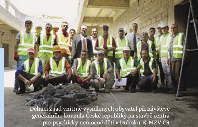
Dělníci z řad vnitřně vysídlených obyvatel při návštěvě generálního konzula České republiky na stavbě centra pro psychicky nemocné děti v Duhoku.