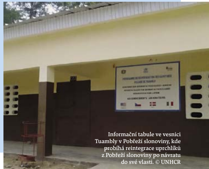
Informační tabule ve vesnici Tuambly v Pobřeží slonoviny, kde probíhá reintegrace uprchlíků z Pobřeží slonoviny po návratu do své vlasti.

V rámci druhého cíle se UNHCR s partnery zaměřil na reintegraci uprchlíků z Pobřeží slonoviny, kteří se vrátili zpět do vlasti. Bylo postaveno 278 domů pro celkem 1 390 osob. 305 mladým osobám bylo poskytnuto odborné vzdělání a 60 nejlepším studentům bylo poskytnuto vybavení, aby si mohli založit svou vlastní živnost. 345 osobám živičím se zemědělstvím byly poskytnuty zemědělské startovací balíčky a tito lidé byli vyškoleni v nových udržitelných zemědělských technikách. V roce 2017 proběhla též rehabilitace 10 vodních zdrojů a byly vytvořeny místní komise pro správu vodních zdrojů, neboť přístup k pitné vodě je i nadále na západním pobřeží Republiky Pobřeží slonoviny jedním z hlavních zdrojů napětí mezi místními komunitami.