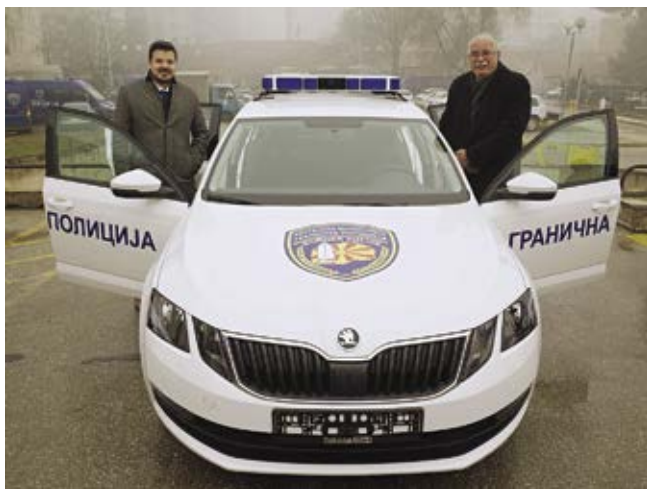
Makedonské pohraniční policii bylo předáno 45 vozů Škoda Octavia.