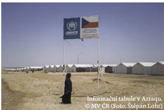
Informační tabule v Azraqu.