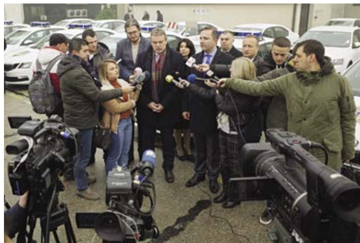
Oficiální předání automobilů makedonské pohraniční policii doprovázel velký zájem médií.