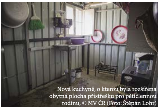
Nová kuchyně, o kterou byla rozšířena obytná plocha přístřešku pro pětičlennou rodinu.