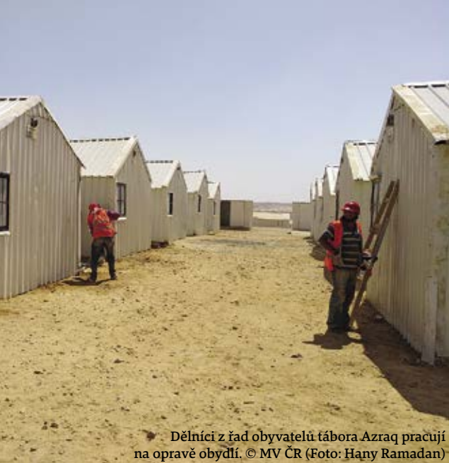
Dělníci z řad obyvatelů tábora Azraq pracují na opravě obydlí.